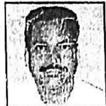
శ్రీ భవనం వెంకటరెడ్డి బల్లూరు పంచాయతీ మాచవరం